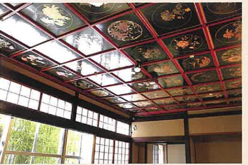
10: 和室(格天井) 地元職人達の手による蒔絵のパネルをはめ込んだ格天井をぜひ一度ご覧下さい。