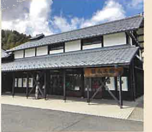
18.19.20: 職人工房 地元伝統工芸士による実際の作業光景を見学することができます。ぜひ、一度ご覧下さい。