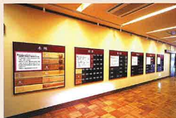
11: 常設展示 漆の伝統的技法による色彩の色々や様々な技法を展示しております。