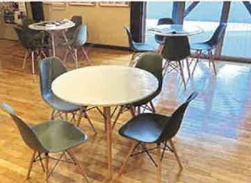
5: 休憩スペース・プチ体験スペース ゆっくり過ごせる休憩スペースと手軽な漆器体験ができるプチ体験スペースです。