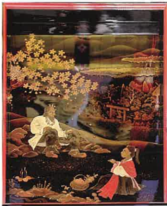
羅体大王と茨田姫の騎絵 (越前塗山車の格天井)

越前漆器の誕生は1500年をさかのぼります。深く美しい色合いは、使う人の心を和ませ、生活に潤いを添えていきます。その技術と歴史、産地としての成り立ちから越前漆器は伝統的工芸品として指定も受けています。その歴史的資料や製造工程と伝統技術を生かした業務用漆器、また、現代的な漆器の取り組みなど産地の特長を見ることができるのがうるしの里会館(鯖江市越前漆器伝統産業会館)です。