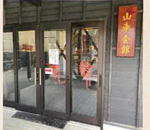
21: 越前塗山車会館 越前塗山車を展示しています。金箔張りの屋根などをご覧いただけます。