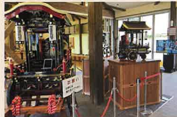
1: エントランスホール ミニ山車とミニチュア山車が展示されており撮影スポットとなっています。またデジタルサインで館内の案内をご覧いただけます。