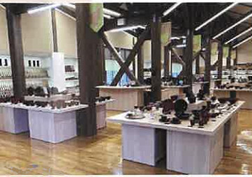
2: ミュージアムショップ 椀や箸、重箱、小物など約1800点の越前漆器を産地ならではの求めやすい価格で販売しております。

2012年に完成した山車は、1500年の技術の伝承である河和田塗りがふんだんに使われています。四季折々の河和田地区の風景をとらえたパネルを是非ご覧ください。漆器職人たちの技の集大成でもあるこの山車は、値をつけることのできない、地域の「宝」と言えるでしょう。