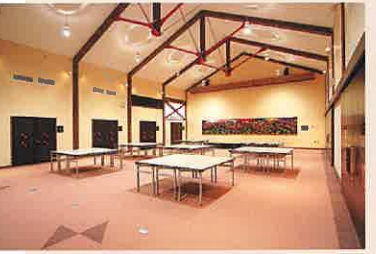
7: 産業振興交流ホール セミナーや研修等、様々な交流の場として多目的な利用が可能となっております。また、ホール内部の壁面には地元職人達の手による横7.3m縦1.2mのうるしパネルを展示しております。