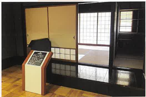
9: 茶室(漆黒庵) 抗菌、効カビ性に優れた環境にやさしい自然塗料である漆で茶室を表現し、産地内で製造される茶道具や、内装としての漆の可能性を表現しております。